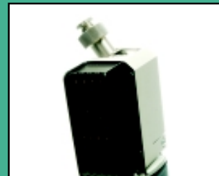
Indbygget udsug med støvfilter, der er let at udskifte.