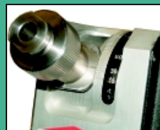
Excenterskive tredobler udnyttelsen af diamantskiven.