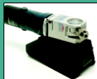
Solid fod til fastgøring af ACU-TIG under slibningen.