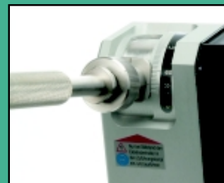
Slibevinkler fra 15-180° (inklusive vinkel).

Vibrationer: 0,63 m/s 2 Hastighed: 23.000 Rpm. Vægt: 2,8 Kg